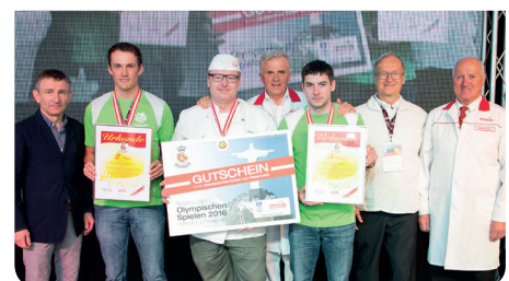
Bild: Siegerehrung backaldrin Handsemmel-Kaiser Wettbewerb 2016

Bitte beachten Sie, dass hier nur eine beschränkte Anzahl an Teilnehmern möglich ist. Zur Teilnahme sind ausschließlich Inhaber und Mitarbeiter von Bäckereien berechtigt. Anmeldungen werden in der Reihenfolge ihres Einlangens berücksichtigt. Bitte füllen Sie auch das Feld „E-Mail-Adresse“ aus. Anmeldeschluss 13.5.2019. Anmeldung auch online unter www.backaldrin.com !