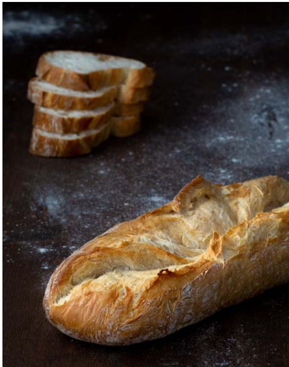
Ein idealer Begleiter für die Grillsaison: Premium Bagelino mit Premium Weizen OP von backaldrin.

Weizenbrot und -gebäck ist der ideale Begleiter für die Grillsaison. Eine perfekte Basis für diesen Genuss ist der Qualitätsrohstoff Premium Weizen OP von backaldrin. Einfache Handhabung und Betriebssicherheit sind gewährleistet. Ein hoher Anteil an Weizensauerteig stellt traditionellen, authentischen Geschmack sicher. Zugleich entspricht Premium Weizen OP dem Wunsch nach nachhaltigen Produkten und ist Clean Label, frei von E-Nummern sowie ohne Palmfett. Darüber hinaus bestechen die Backwaren mit hervorragender Krumenelastizität, sodass ein rundes Gesamterlebnis entsteht. Bestens geeignet für die Grillsaison sind Premium Bagelino und Premium Sabia Baguette – sie ergänzen den Grillgenuss und runden ihn perfekt ab.