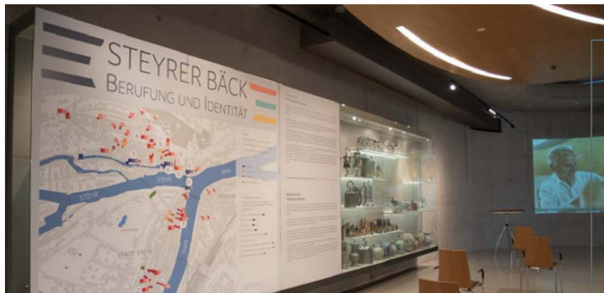
Bäckereigeschichte mit lokalem Bezug gibt es seit April 2021 im PANEUM, das Partner der OÖ Landesausstellung ist.