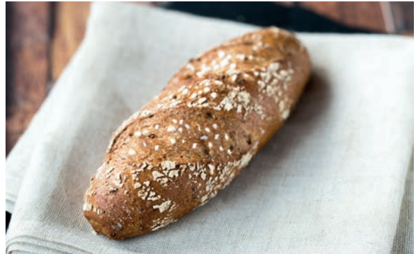
Österreichischer Klassiker und Regionalitäts-Champion: Original Kornspitz. In ihm stecken hochwertige Rohstoffe, die nach Originalrezeptur zu 92 % aus Österreich stammen.