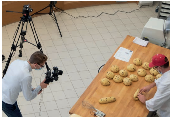
In virtuellen Schulungen und Präsentationen werden alle Anwendungsschritte direkt von den Kameras erfasst und sind so für Teilnehmer bestens nachzuverfolgen.

Außerdem wird der internationale Austausch über alle Firmen weltweit auf eine neue digitale Basis gehoben und Abläufe im Produktionsschichtbetrieb fußen ebenfalls auf neuen digitalen Möglichkeiten, die vieles vereinfachen. Und die Projekte haben eines gemeinsam: Sie alle haben das Ziel, entweder etwas Bestehendes zu verbessern bzw. zu erweitern oder in kollektiver Zusammenarbeit einen neuen Ansatz zu entwickeln, der etwas vereinfacht und damit den Ablauf noch eine Spur besser macht und zum Erfolg beiträgt. ■