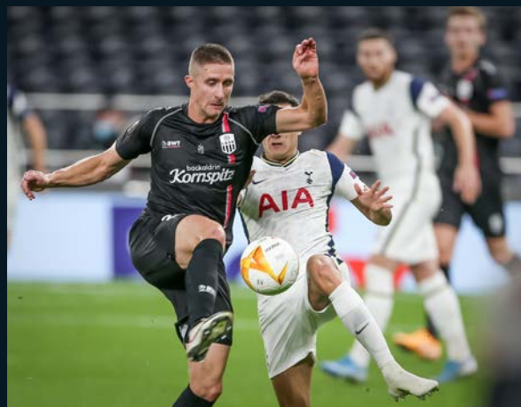
Der LASK traf in der vergangenen Saison 2020/21 unter anderem auf Tottenham Hotspur.