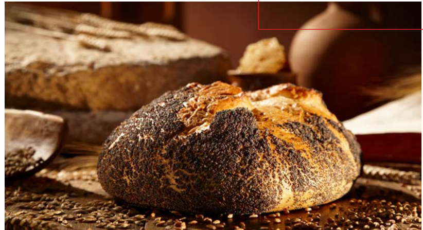
So kommt Honig etwa im Bibelbrot® von backaldrin zum Einsatz.

FEINE HONIGNOTEN RUNDEN DEN GESCHMACK VON BROTKREATIONEN AB.