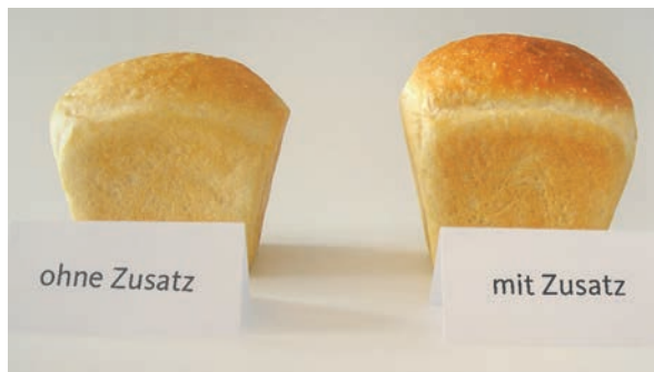
Abb. 2: Effekt von Enzymen auf das Brotvolumen. Weißbrot ohne Enzymzusatz (l.) im Vergleich zu Weißbrot mit Enzymzusatz (r.): eine deutliche Volumenzunahme ist erkennbar.

Die Effekte, die man mit Enzymen in der Backwarenherstellung erreichen kann, sind vielfältig. Sie reichen von längerer Frischhaltung, der Bräunung der Kruste, einer zarteren Rösche, der Steigerung von Wasserbindung und daraus resultierenden trockenen, weniger klebrigen Teigen, die ein höheres Gebäckvolumen haben (Abb. 2) bis zur Erhöhung der Gärtoleranz. Zudem vermindern Enzyme das Zusammenziehen von Teigen (Schnurren), ermöglichen den teilweisen oder sogar gänzlichen Verzicht auf Emulgatoren und vermindern die Entstehung von Acrylamid beim Backen. Generell wirken sie sich positiv auf die Teigstabilität aus.